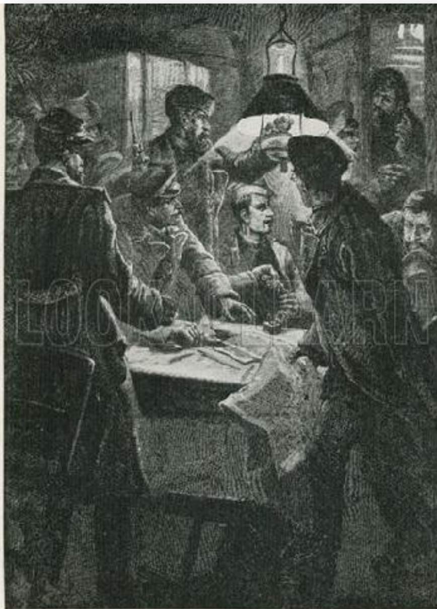
POLICE SURPRISING A MEETING OF RUSSIAN NIHILISTS