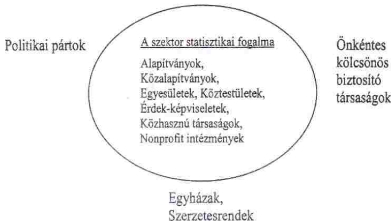
8. sz. ábra: A nonprofit szektor jogi és statisztikai fogalmának kapcsolata